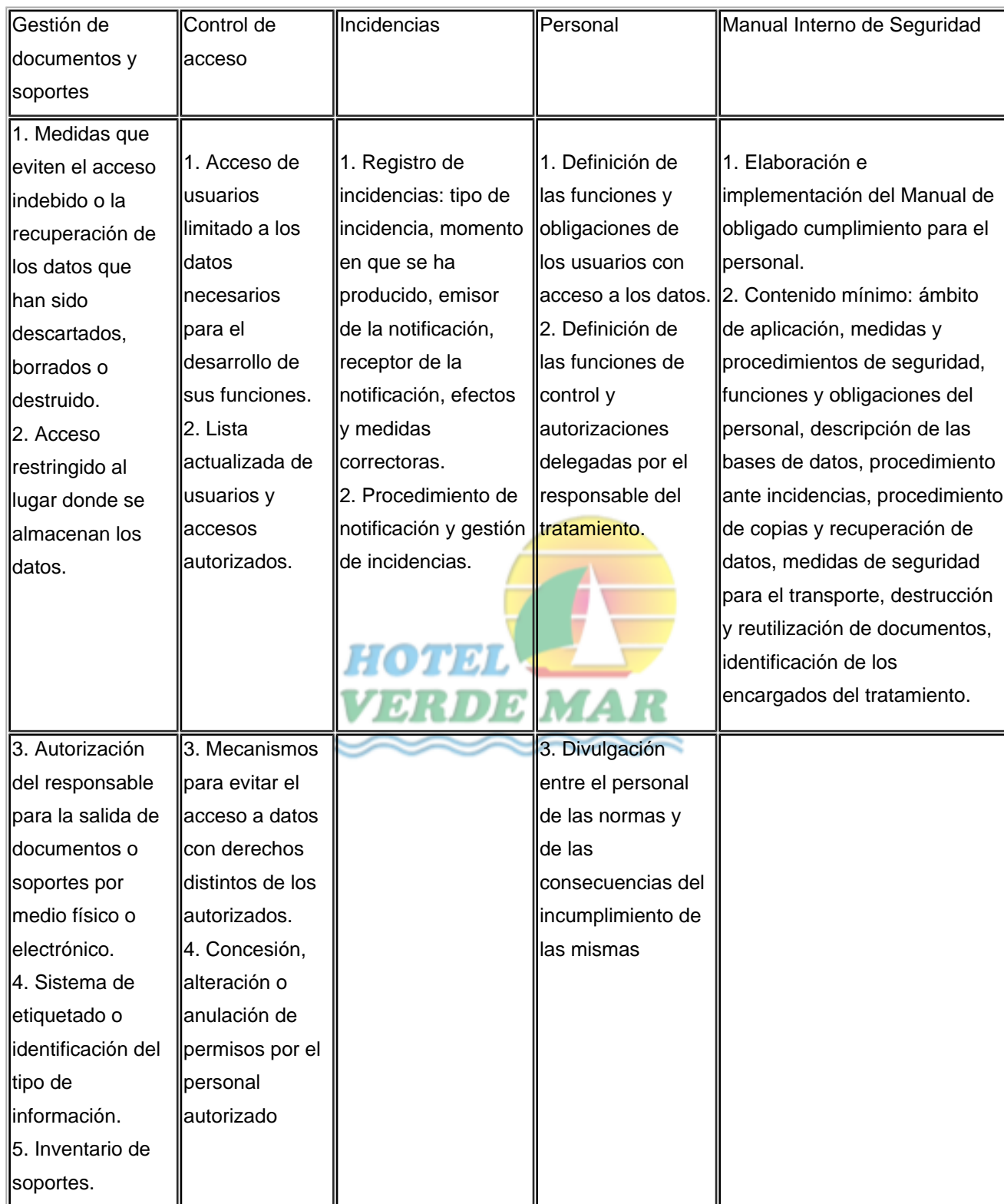
TABLA I: Medidas de seguridad comunes para todo tipo de datos (públicos, semiprivados, privados, sensibles) y bases de datos (automatizadas, no automatizadas)